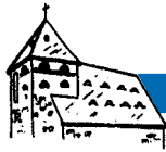
St. Apollinaris Frielingsdorf