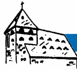
St. Apollinaris Frielingsdorf